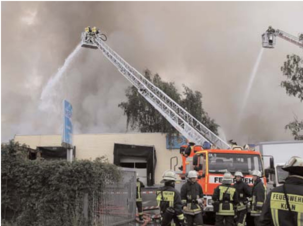
Feuer 5 - Köln-Mühlheim

OFFIZIELLES ORGAN DES STADTFEUERWEHRVERBANDES KÖLN E.V.